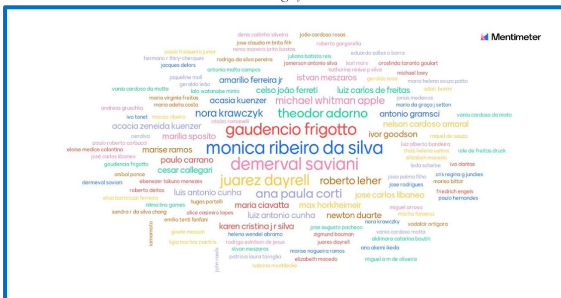
Figura 1. Quais os principais teóricos citados nos Artigos que compuseram o corpus de nossa investigação?

No percurso dessa investigação, a fim de construir uma relação de referencial teórico na temática pesquisada, a partir das referências de cada um dos artigos, construímos uma nuvem de palavras, produzida com o uso da plataforma mentimeter online para criação e compartilhamento de apresentações de slides com interatividade. Todos os autores referenciados na seção “Referências” dos 11 artigos foram colocados na plataforma, conforme a Figura 1: