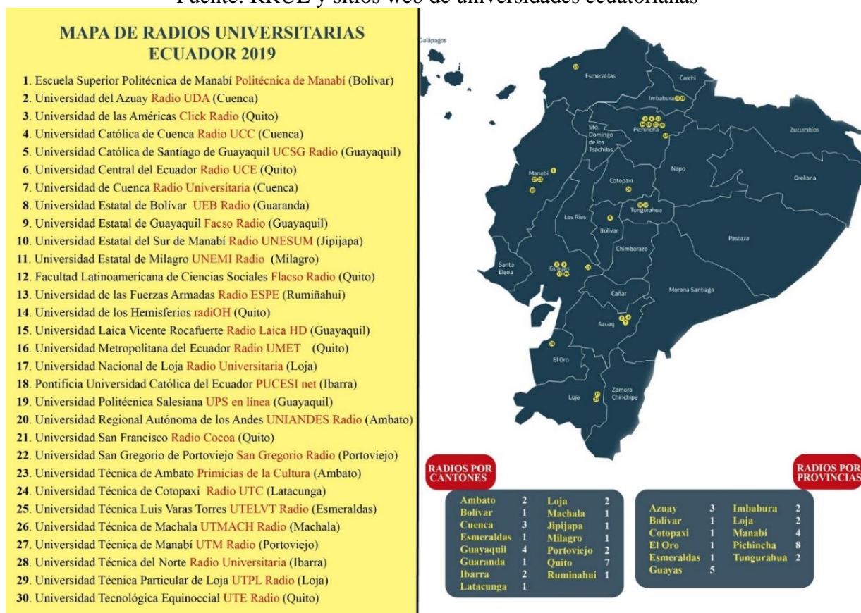
Figura 2: Mapa de Radios Universitarias en Ecuador 2019

Fuente: RRUE y sitios web de universidades ecuatorianas