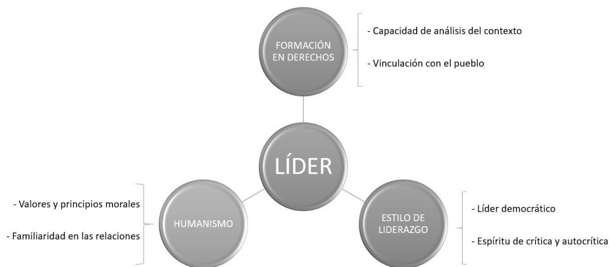
Figura 2: Categorías de entrevistas a profundidad sobre liderazgo